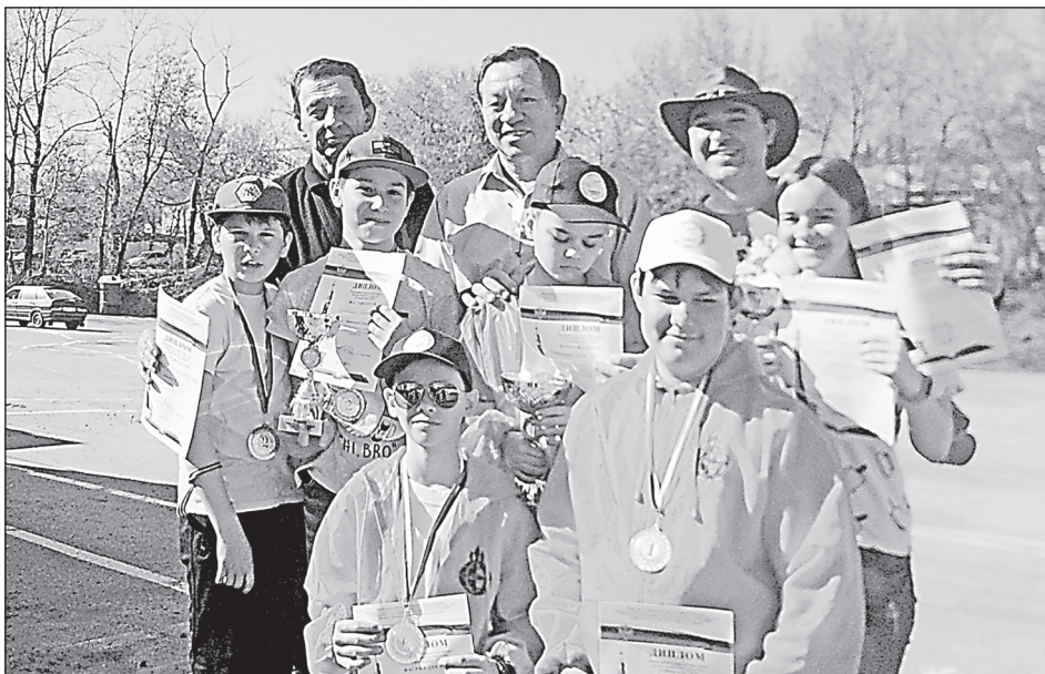
Сборная Самарской области на Первенстве России по авиамodelьному спорту в классе кордовых авиамodelей, г. Пенза, 5 мая 2016 года (тренер А.У. Гарфутдинов).

ставление о робототехнике, строят роботов, находящихся выход из лабиринта, ориентирующихся на источник света и звука, ультразвуковой дальномер.