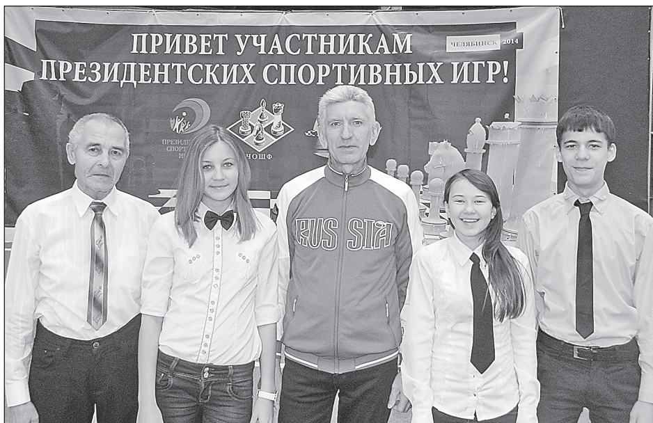
Сборная Самарской области по шахматам на Президентских играх.

На базе ДЮСШ создан районный учебно-методический центр для учителей физической культуры и тренеров-преподавателей, что позволяет организовывать и проводить на более высоком уровне совместные методические объединения, семинары, тренерские советы, мастер-классы по видам спорта; разрабатывать и внедрять современные методики и инновационные технологии преподавания уроков физической культуры и учебно-тренировочных занятий. Опыт и знания тренеров-преподавателей ДЮСШ востребованы учителями физической культуры района. Ведь только специалист в своём виде спорта может грамотно выстроить систему работы по тому или иному разделу программы, предупредить ошибки. Своим опытом делятся и учителя физической культуры: инновационная деятельность, совершенствование образовательного процесса на основе информационно-коммуникационных технологий и др.