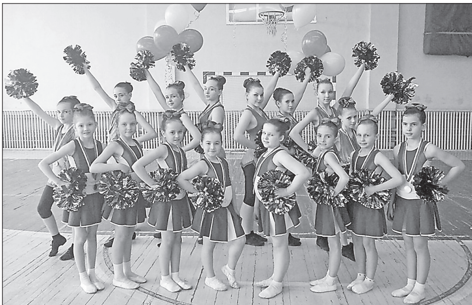
Призёры планеты Чир, Тольятти 2017.

Ежегодно услугами дополнительного образования детей физкультурно-спортивной направленности пользуются 1500 учащихся общеобразовательных учреждений м.р. Похвистневский, открыто 95 учебно-трениро-